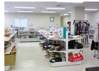
リサイクルプラザKC